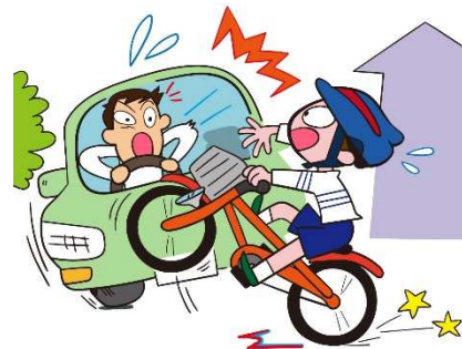
会社周辺の危険予測地図